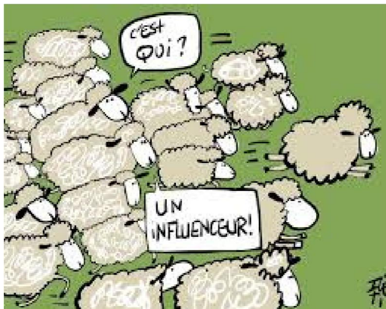
Caricature sur les influenceurs et leurs communautés (Ice Ti, Facebook)

internautes sur leurs contenus. Il revient donc à chacun d'apprendre à prendre du recul afin de ne pas se laisser influencer aveuglément.