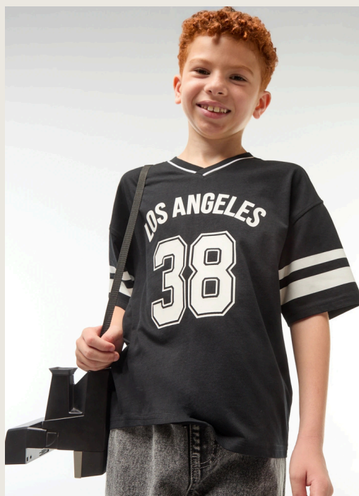
site officiel du magasin français KIABI

Les séries comme Euphoria ou Riverdale influencent fortement les jeunes. Les vendeuses de magasins de vêtements observent la même chose : les adolescents demandent principalement des marques américaines. Cette mode représente plus qu'un style : elle renvoie à une image de liberté, de réussite et de modernité.