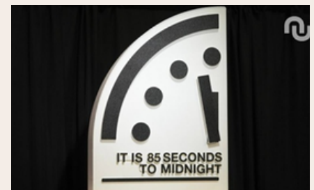
Horloge de l'apocalypse en janvier 2026-numerama

ce qui traduit un niveau de danger très élevé. Ce type d'indicateur marque les esprits et contribue à sensibiliser les jeunes à la gravité de la situation